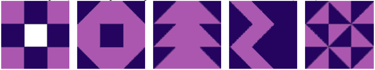
Рис. 2. Образцы для второй серии заданий из 9-ти элементов (3 x 3).