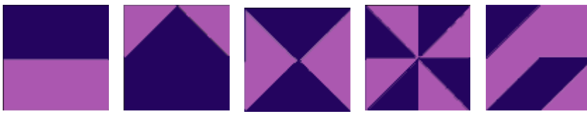
Рис. 1. Образцы для первой серии заданий из 4-х элементов (2 x 2).